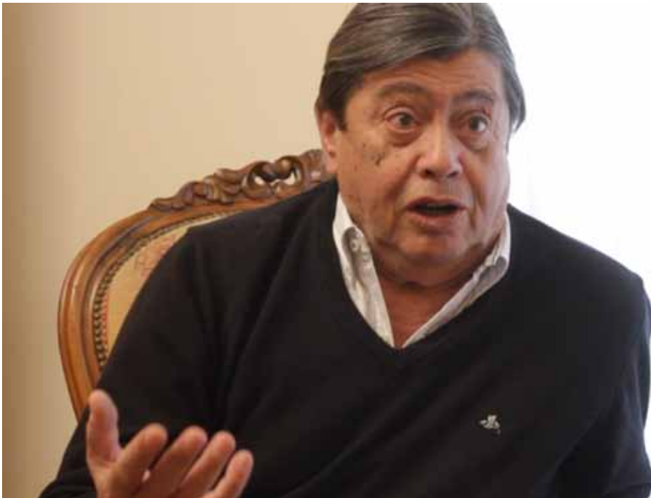
PEDRO DASSO, VETERINARIO EXPRESIDENTE MANDATOS 1995 / 2003