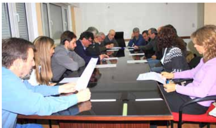
Primera reunión de Directorio 2015 y placa de directores completa.