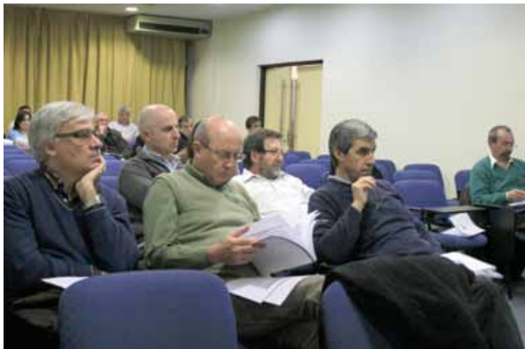
Imagen de la última Asamblea Ordinaria realizada en el Consejo Profesional de Ciencias Económicas.

En la Institución la Asamblea como órgano máximo de funcionamiento. La mayoría de las profesiones tiene 5 representantes en dicha Asamblea. El órgano ejecutivo es un Directorio que está formado por un representante de cada profesión. Esos Directores no perciben sueldo y su trabajo es totalmente ad-honorem, tienen un mandato de 2 años, pueden ser reelectos por un período más, pero cumplidos los dos períodos, deben dejar su lugar como mínimo por un período.